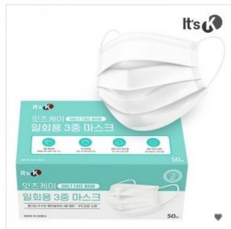
국내산 잇츠케이 KFAD 마스크 (50매/100매 선택가능) 식약처인증/박스포장

국내 제조 공장에서 유통까지 책임져 믿고 사용하실 수 있는 마스크입니다.