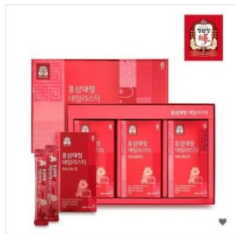
[정관장] 홍삼대정 데일리스틱 10ml*30포