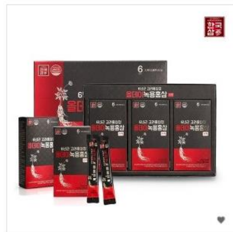
[한국삼] 6년근 고려홍삼정 올데이 녹용홍삼스틱