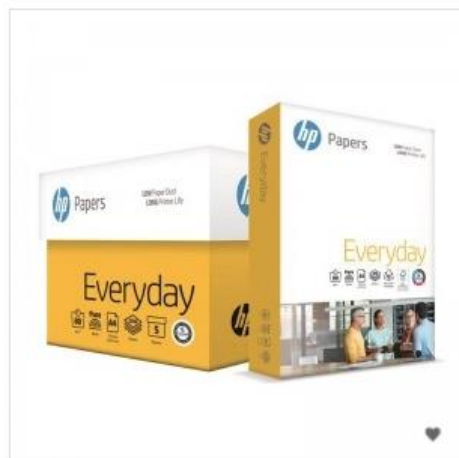
HP복사용지 A4 80g 2500매